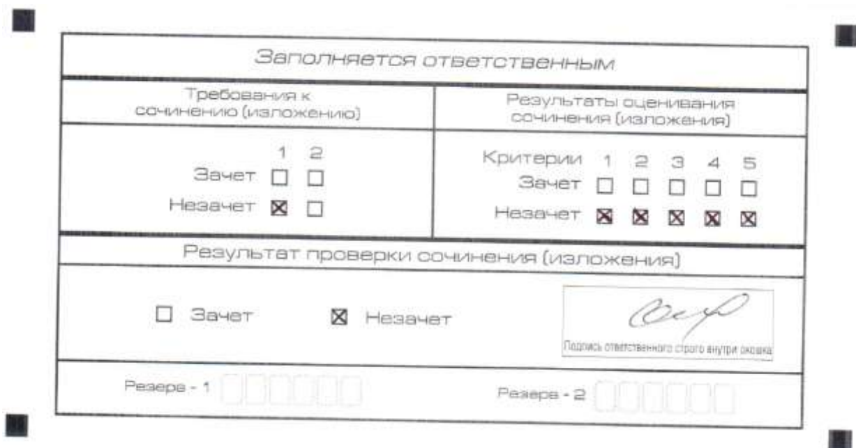
Рис. 5. Область для оценки работы

Эксперт комиссии (ответственное лицо) выставляет «незачет» за невыполнение требования № 2. В клетки по всем пяти критериям оценивания выставляется «незачет». В поле «Результат проверки сочинения (изложения) ставится «незачет».